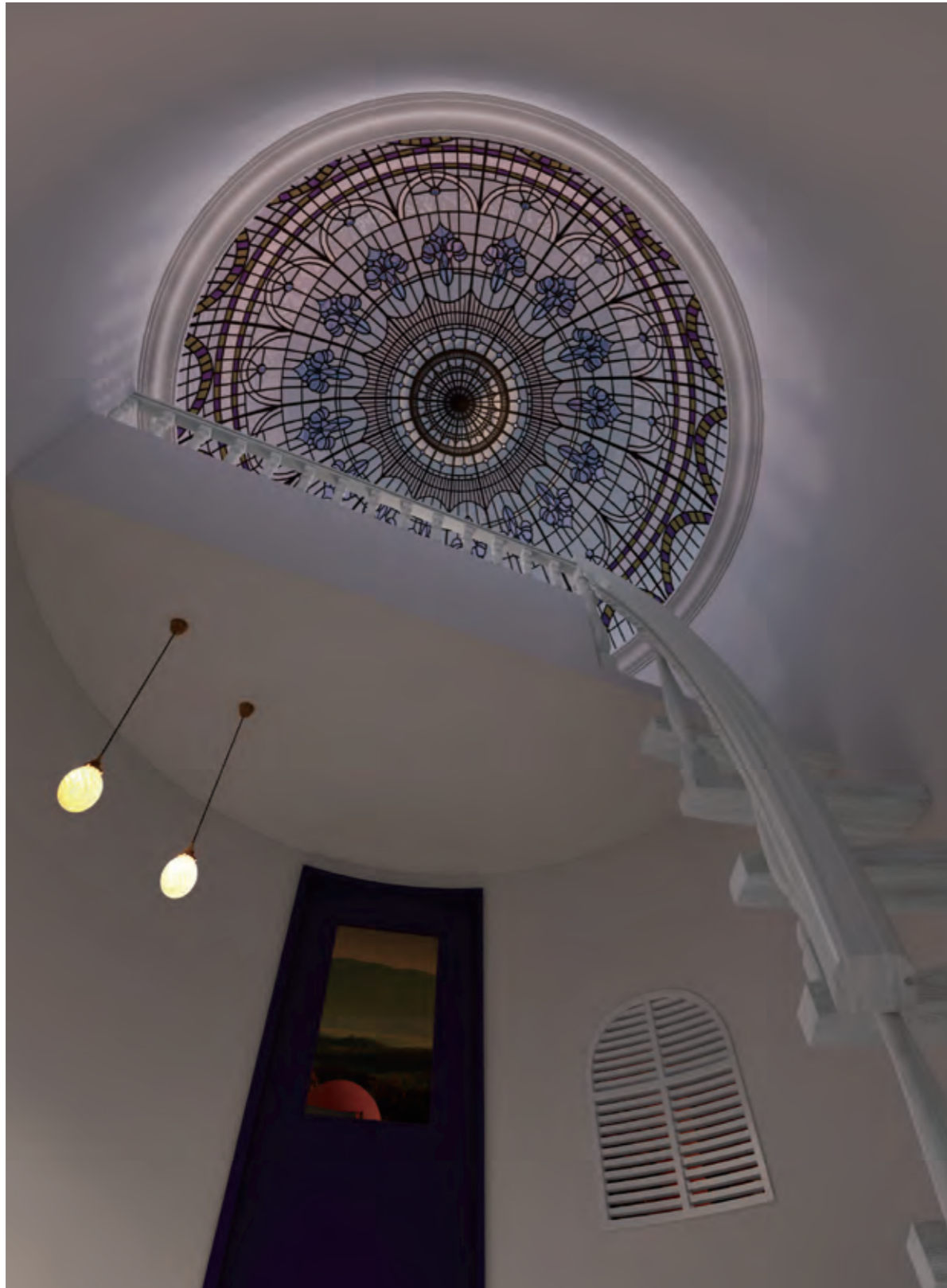
美しい曲線で仕上げられたエレガントで品格を感じさせる空間をあなたが独占。