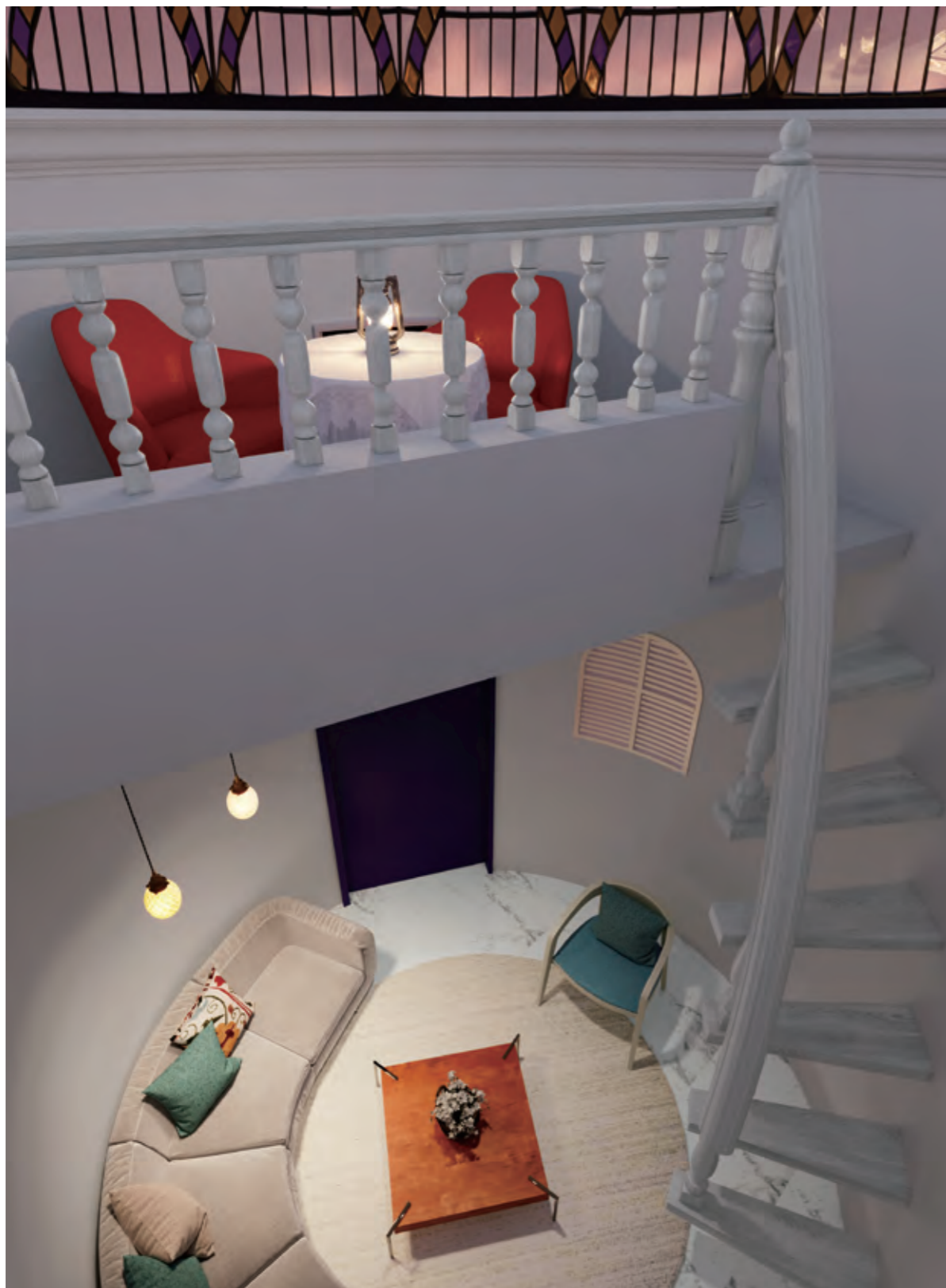
ロフトで仕切られた豪華なスペース。都心から離れ日常を忘れさせる癒しの場所に。